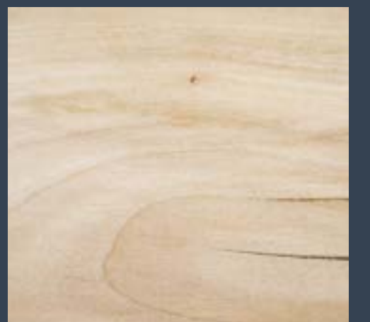
Ezki hostozabala Tilia platyphyllos