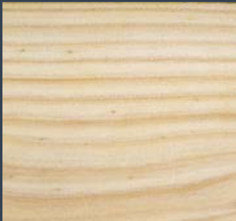
Araukaria Araucaria araucana