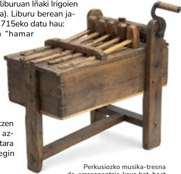
Perkusiozko musika-tresna da, erresonantzia-kaxa bat, bost mailu eta biradera duen arrabol bat. Aste Santuko ilunpeko ofizioetarako. Arzubiagako (Araba) eliza. Haritza eta zumarra. Euskal Museoa Bilbao.

ipintzen zaizkio goiko puntan)". Abadiñoko udal artxibategian jasoa dago 1926an zortzi erreal ordaindu zirela San Torkaz eguneko jaietarako maiatza ekartzeagatik ( Garai: costumbres, fiestas y danzas liburuan Iñaki Irigoien Etxebarriak jasoa). Liburu berean jasoa da Garaiko 1715eko datu hau: ordaintzen dira "hamar erreal ohi bezala jarri den San Joan eguneko arbolaren kostua". Getxon abuztuko jaietan Donibane-zuhaitza kaiko hondartzatxoan zutitzen da eta bigantxa azpian dabilela bertara igotzeko saioa egin behar da.