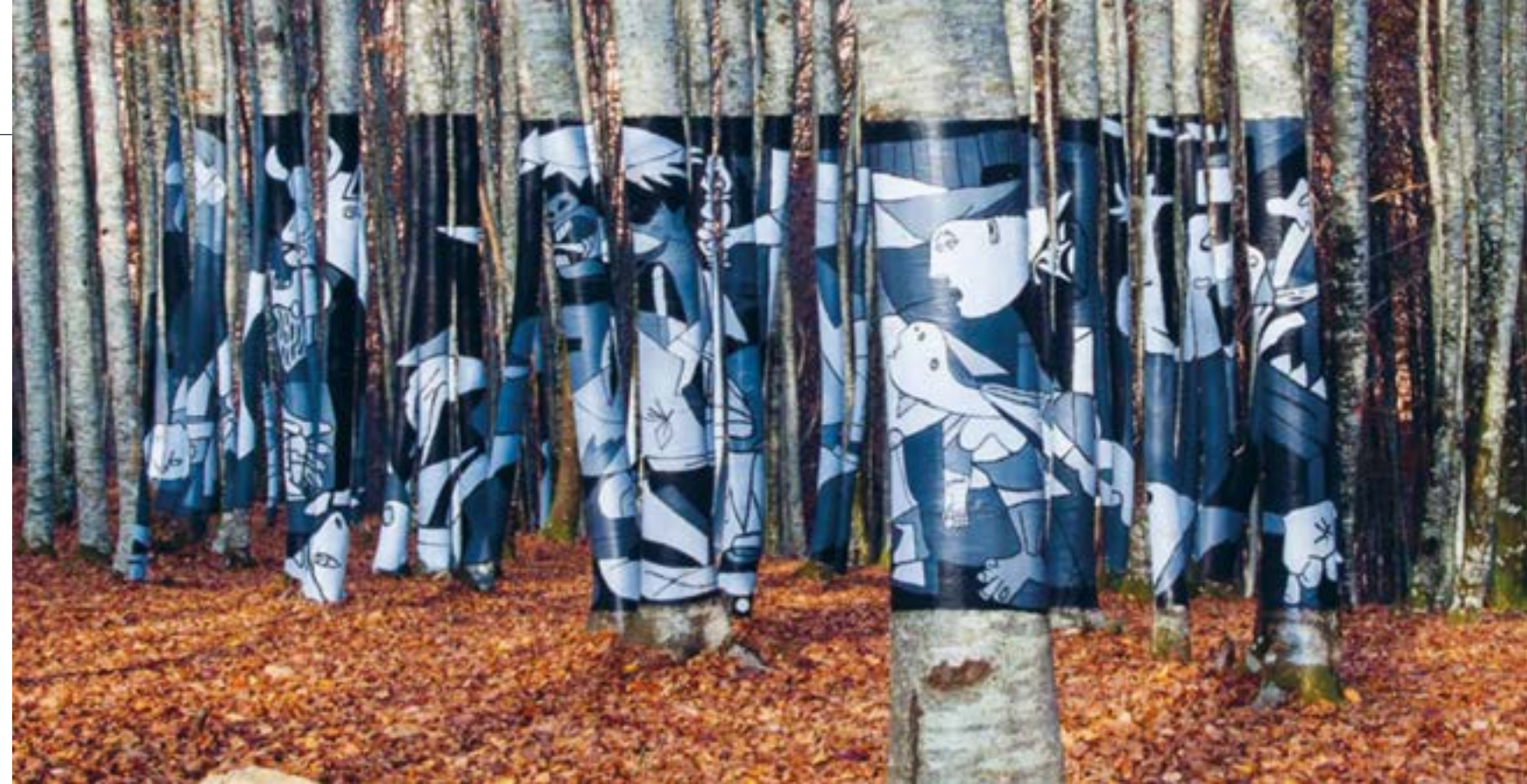
2012an, Zilbetiko basoa (Erroibarko Udala, Nafarroa) meatzaritza proiektu baten mehatxupean zela, Monte Alduide koordinatzailearen ekimenez egindako murala.