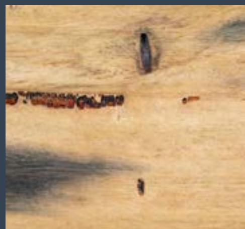
Eukalpto urdina Eucalyptus globulus