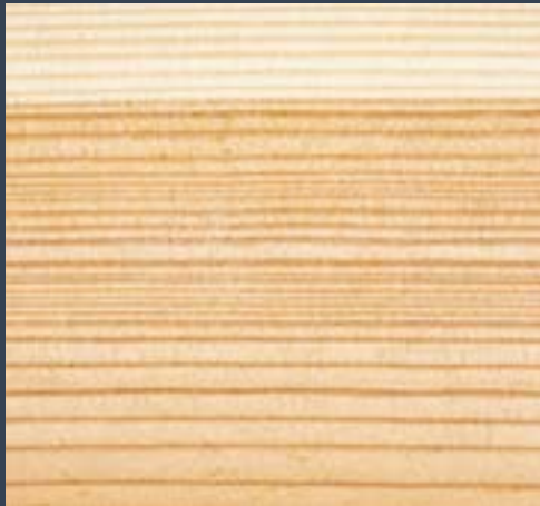
Alertzea Larix decidua