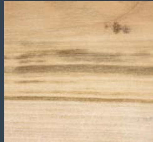
Basagereziondoa Prunus avium