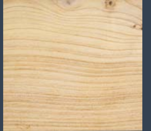
Altzifre arrunta Cupressus sempervirens