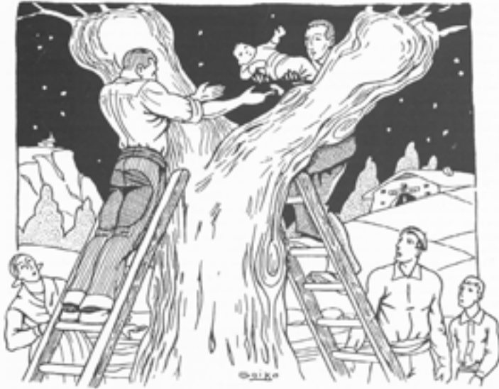
Zuhaitz sendatzailea, Aurizperri (Nafarroa).