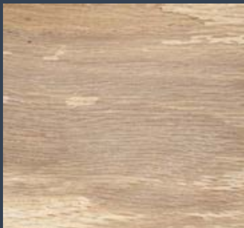
Artelatza Quercus suber