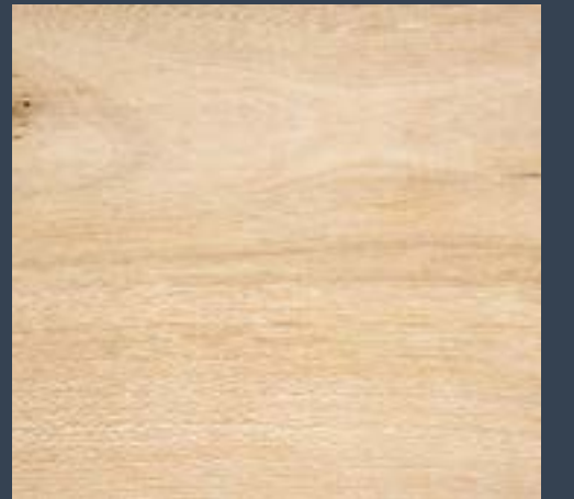
Ereinetza Laurus nobilis