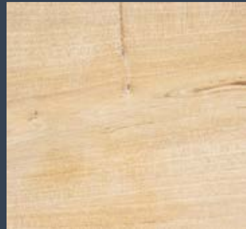
Baso-makatza Pyrus cordata