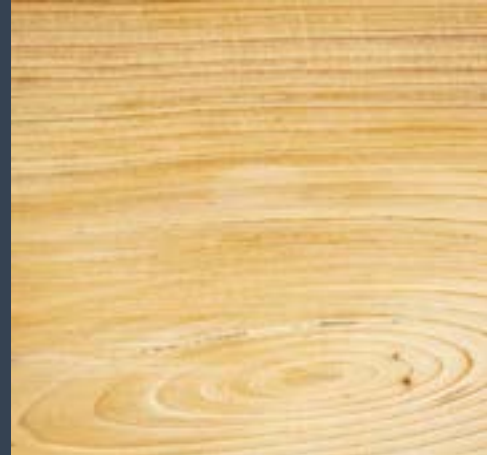
Atlasko zedroa Cedrus atlantica