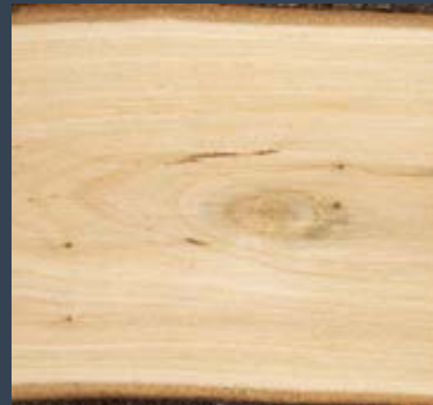
Elorri beltza Prunus spinosa