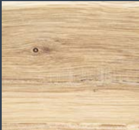
Ametz llaunduna Quercus humilis