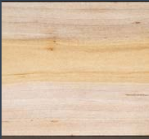
Ahuntz sahatsa Salix caprea