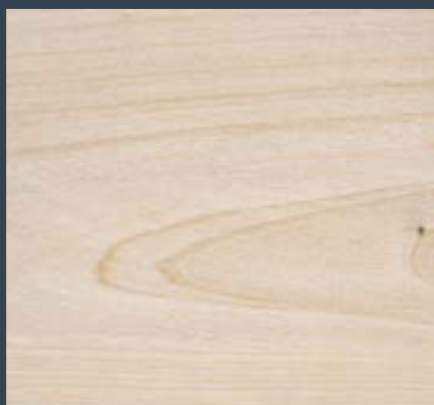
Astigar zorrotza Acer platanoides