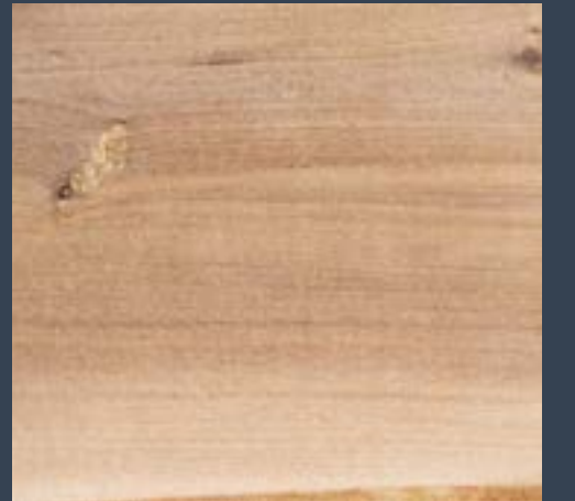
Udareondoa Pyrus communis