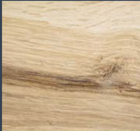
Ametza Quercus pyrenaica