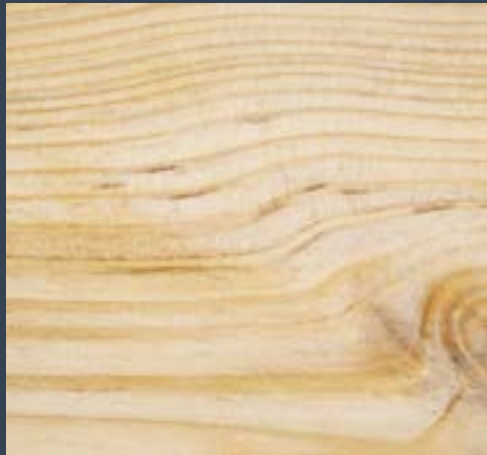
Alepo pinua Pinus halepensis