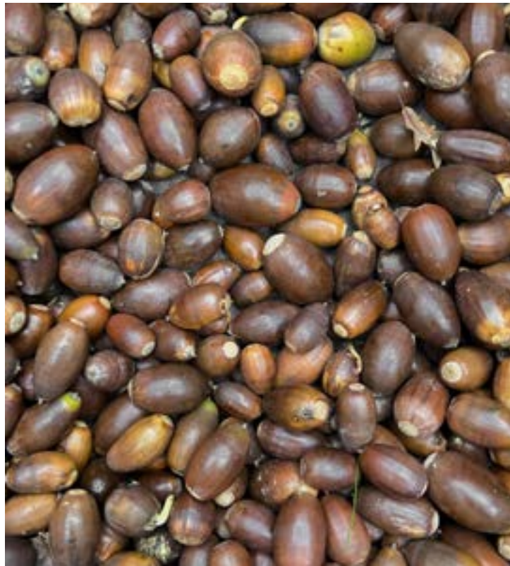
Haritz kandugaberaren ezkurak.

Haziak heldutasun maila onena izatea komeni da. Hori zuhaitzean bertan egonda gertatzen da; hazia edo bera biltzen duen fruitua lurrera erori denean, gehienetan, heldu da. Heldutako haziak fruitu alean bertan eduki daitezke hura usteldu arte. Fruituaren mamia usteldutakoan, haziak atera eta ahal izanez gero, neguan kanpoan sentituko luketen egoeran mantendu behar dira. Mamitsuak ez diren fruituak (ezkurak, intxaurrak, hurrak...) ahalik eta azkarren jaso, ez lehertzeko.