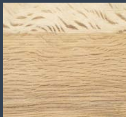
Erkametza Quercus faginea