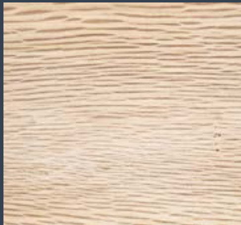
Arte kantauriarra Quercus ilex subsp. ilex