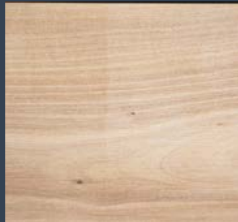
Basagurbea Sorbus torminalis