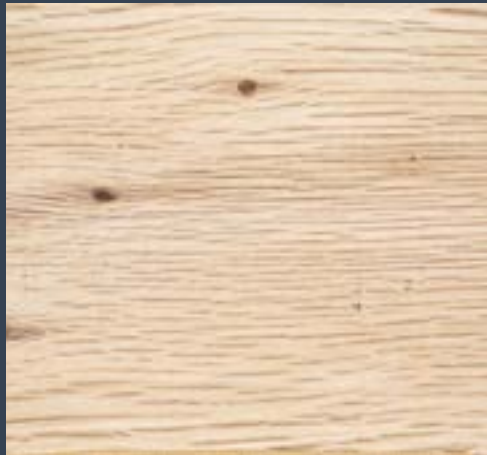
Abaritza Quercus coccifera