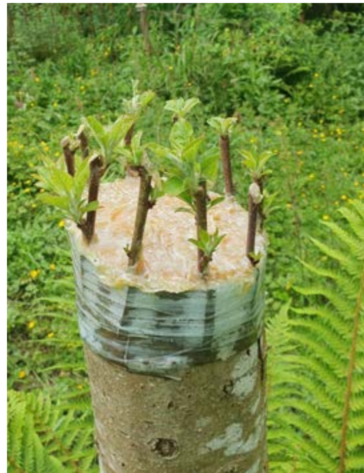
Koroa erara txertatutako sagarrondoa.

Txertaketa teknika garestia da eta zuhaitz edo arbola bereziak sortu nahi direnean erabiltzen da. Fruta arboletan ezaguna da, baina baita parke eta lorategietan erabiltzen diren espezie batzuetan ere.