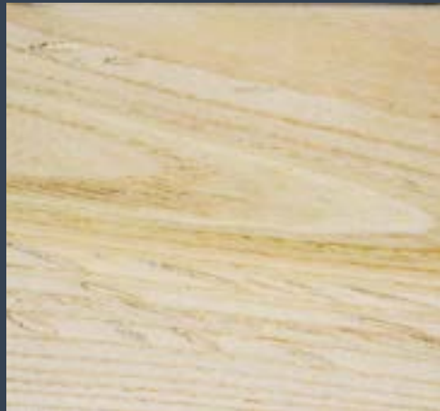
Ailantoa Ailanthus altissima