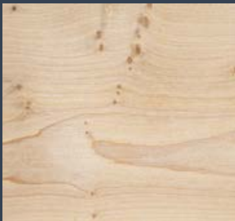
Astigar arrunta Acer campestre