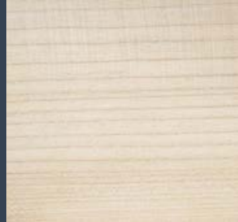
Astigar zuria Acer pseudoplatanus