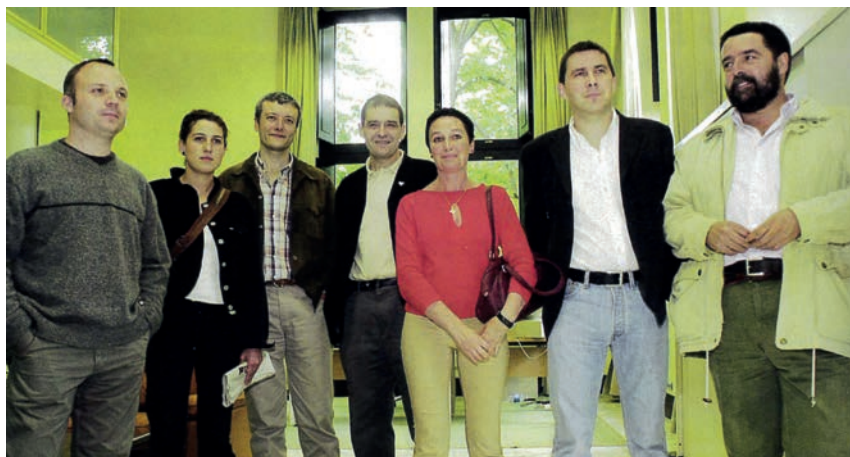
JON HERNANZ / FOKU