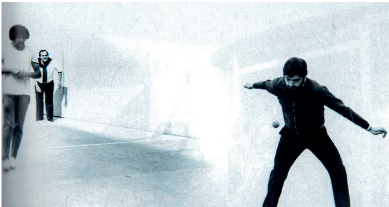
URRUTIKOETXEA BENGOTXEA SENDIA