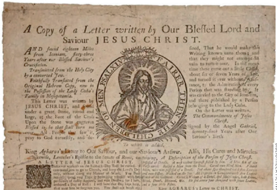
Jesu Kristok zerutik bidali omen zuen gutuna, atsedean eguna larunbatetik igandera aldatzea justifikatzen duena. Horrelako dokumentuak daude Johns Hopkins unibertsitateko Bibliotheca Fictivaren bilduman.

Bi idatzi horien kopiak Johns Hopkins unibertsitateko (Baltimore, AEN) Bibliotheca Fictivan daude gaur egun. Faltsifikazio historiko eta literarioak biltzen dituen liburutegi berezi hori 22.000 dokumentuz osatuta dago. Aipatutakoez gain, bilduma horretan daude, esterako: Jesu Kristok berak zerutik bidalitako gutuna, atsedean eguna larunbatetik igandera aldatzea justifikatzen duena, eta ziurtagiri modura Gabriel arkanjelua sinadura duena; Diktis