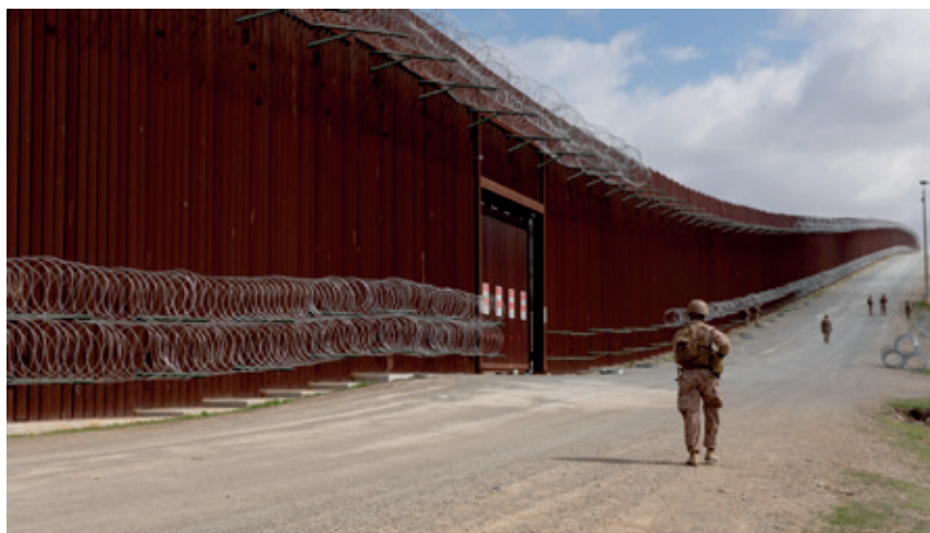
ESTATU BATUTAKO GOBERNUA

Funtsean, txiroa den jendeak nagusiki emigratzen du landa guneetatik hirietara (mundu mailako migratzaileen %80), eta gehien jota inguruko herrialdeetara; Ipar aberatseko herrialdeetara abiatzen da dagoeneko aurrezki batzuk bil-