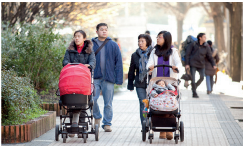
DANI BLANCO CC BY SA

Immigratzaileak eskulan beharra dagoenean datoz, eta ez ongizate estatuak eskaintzen dituen abantailez baliatzera, sarritan zabaltzen den moduan.