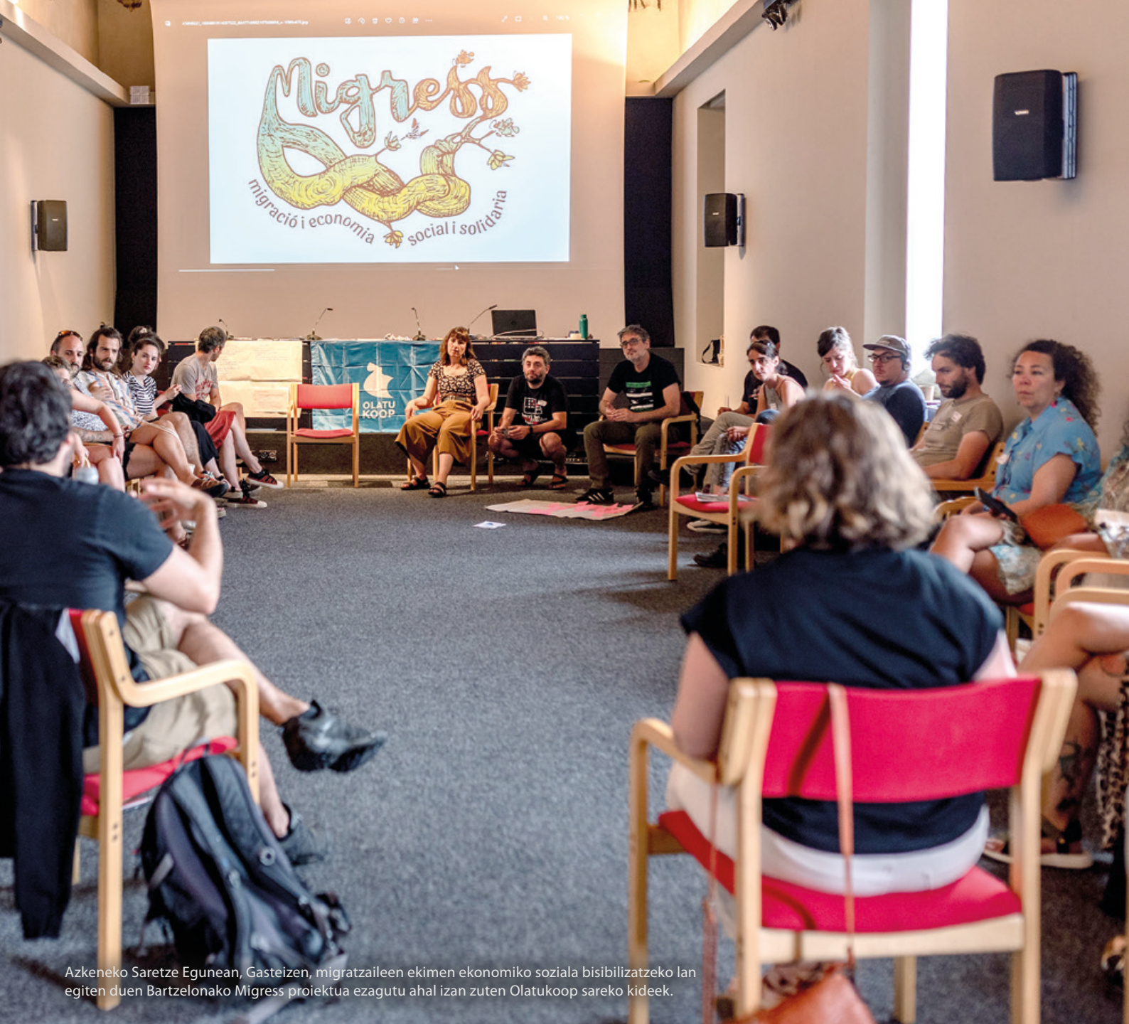
Azkeneko Saretze Egunean, Gasteizen, migratzaileen ekimen ekonomiko soziala bisibilizatzeko lan egiten duen Bartzelonako Migress proiektua ezagutu ahal izan zuten Olatukoop sareko kideek.