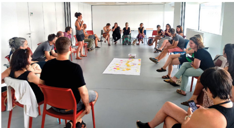
Olatukooppek batzarrean hartu ohi dituzten sarearen erabaki garrantzitsuenak.

Eta aurrera begira zer? Ekonomia eraldatzailea iparrorratz hartuta, motxila bete lan dute, gutxienez beste hamar urtetarako. Lurraldeetan zabaldu eta aldi berean sare horizontal gisa egitura orekatu bat mantentzea izango da egiteko zailenetako bat. Egitura handi eta zentralizatuerei erreparoz begiratu izan diete beti Olatukoopon, baina azken batzarrean garbi ikusi zuten profesionalizatorako pausoak eman behar dituztela, eta bestalde, azaldu dutenez, Nafarroan eta Ipar Euskal Herrian figura