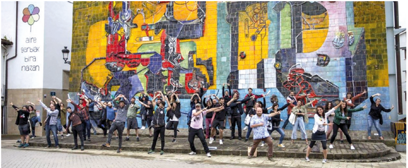
Olatukoopet Usurbilen egindako batzar baten osteko argazki "ofiziala". Ekonomia eraldatzaileko dozenaka enpresa komunitario eta erakunde biltzen ditu sareak.

kin nahi duenak, Ikusgelak Wikipedian paratutako bideoa bea dezake nahi badu.