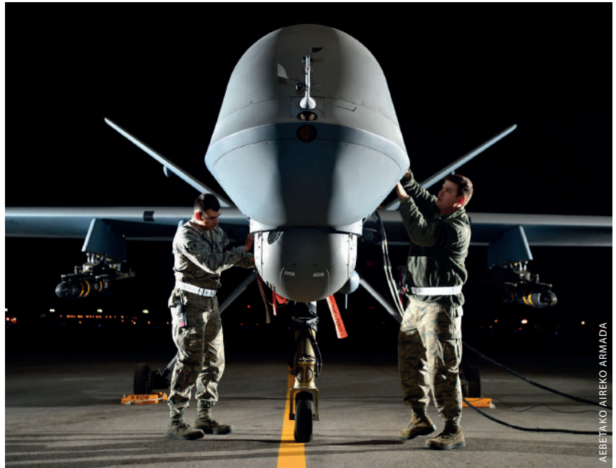
AEBETAKO AIREKO ARMADA

Aireko dronea, lehen begiratuan, goi-teknologiako metalezko aparatua da, zeruak tripulaziorik gabe zeharkatzeko sortua. Gailu hauek telegidatutako hegazkin zaharren