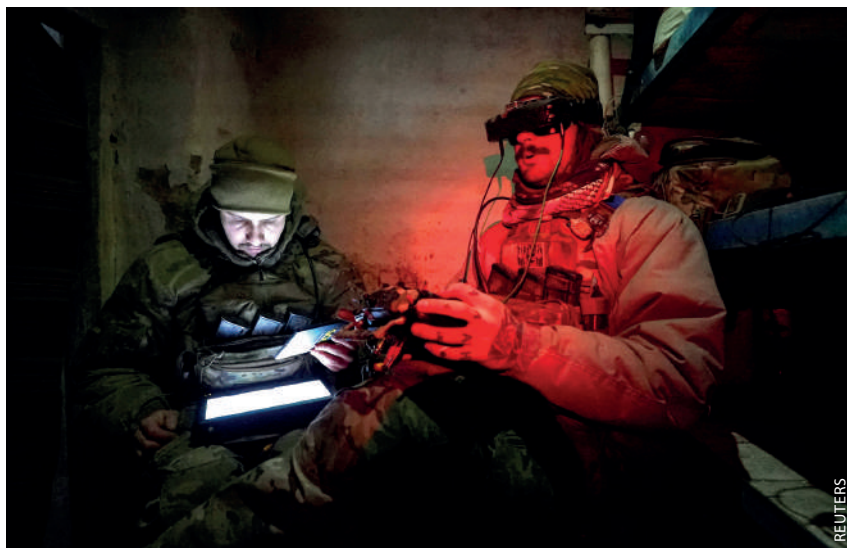
UKRAINAKO soldadu batzuk drone bat kontrolatzen bunker batetik 2024ko urtarrilean.

Kontuan hartu behar da Mendebaldeko droneek bonbardatu dituztenen erreakzio armatua. Berbarako, Iranek droneak eskala masiboan ekoizten ditu. Horietako batzuek 1.500 km baino gehiago hegan egiteko gaitasuna dute, eta, ustez, 10 eta 100 metro arteko perimetroan jotzen asmatzen dute. Matxino talde armatu askok ere droneak erabiltzen ditu. Denetarik daude, batzuk sofistikatuagoak dira, hala nola Shahed irandarrak. Apirilaren 13an, Israelen menpeko lurraldearen aurka Iranek inoiz egin duen lehen erasoan 300 bat misil eta drone jaurti zituen, eta tartean ziren Shahed-136 modelokoak. Yemengo huthiek ere horiek erabiltzen dituzte Israelerako bidean dauden itsasontzien aurka. Beste batzuek "etxe" droneak dituzte, adibidez, erresistentzia armatu palestinarrik urriaren 7an erabili zituenak. Eraso abiaturik drone txiki batzuek indargabetu zituztenean Gazako harresiaren defentsak eta zaintza-postuak. Defentsa sionistak "itsutu" ondoren, harresia eraitsi