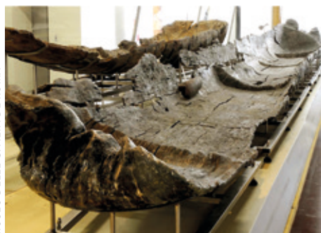
MUSEO DELLE CIVILTÀ DE ROMA

Azken hiru urtetan David Blight historialaria buru duen Yale unibertsitateko lantalde batek ere lotura hori xehe aztertu du. Duela aste batzuk, Yale and slavery: a history izeneko liburu mardula aurkeztu du unibertsitateak, ikerlan hori jasoaz. Horrekin batera, Yale unibertsitateak barkamena eskatu du instituzioak esklabotzarekin izan zuen loturagatik. Baina barkamen ofizialean izena aldatzeko aukera ez da aipatu ere egiten. ●