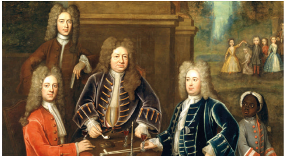
Egile ezezaguneko koadro honen erdian Elihu Yale ageri da, Yale unibertsitateari izena eman zion negozio gizona. Eskuinaldean, haur esklabo bat dago.