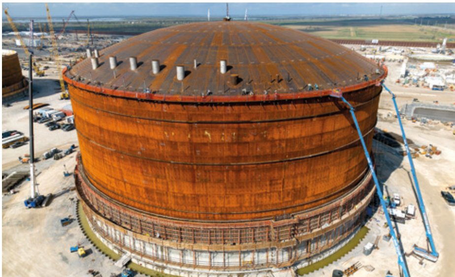
PLAQUEMINES Mississippiko deltan Venture global enpresa egiten ari den GNL plantaren tanke bateko sabaia jasotzeko momentua. 200.000 metro kubo gas biltegitratu ditzake berak bakarrik.