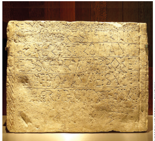
ARABAKO ARKEOLOGIA MUSEOA

Ezkerrean, Tobillas herriaren eta Sernaren aire irudia; nekazaritzarako eremua (horiz) dike zabal batek babesten du Omecillo ibaitik. Eskuinean, San Roman elizan mantendu den eta 939. urteko data daraman inskripzio epigrafikoa; egun Arabako Arkeologia Museoa dago ikusgai.