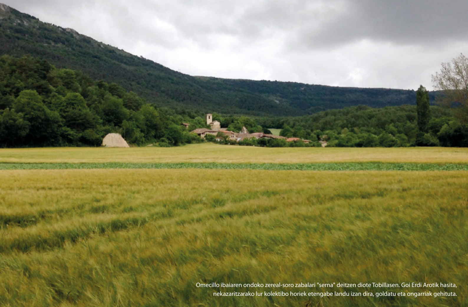
Omecillo ibaiaren ondoko zereal-soro zabalari "serna" deitzen diote Tobillasen. Goi Erdi Arotik hasita, nekazaritzarako lur kolektibo horiek etengabe landu izan dira, goldatu eta ongarririk gehituta.

ruan gorpuztu zituzten harremanak lurralde haietako Goi Erdi Aroko nekazari eta jauntxoek.