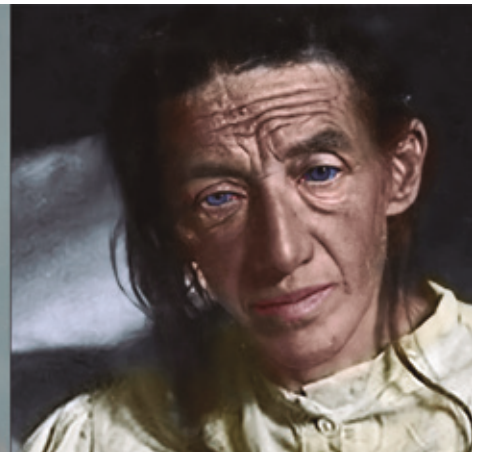
Ezkerrean, Alois Alzheimer psikiatra; eskuinean, Auguste Deter pazientea. 1901ean "ahantzuraren gaixotasuna" diagnostikatu zion.