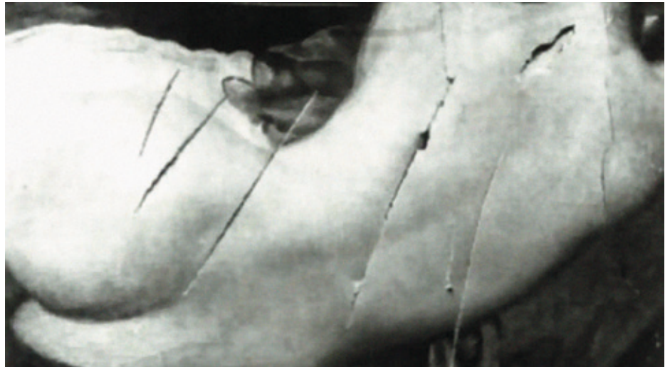
Velazquezen Ispiluko venus , sufragistek sastakatu.

Arrazoi politikoek ere bultzatu dute ikonoklasia. Frantzian, 1789ko iraultzaren ondoren, Antzinako Erregimenaren sinboloak desagerrarazi nahian, eliza