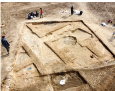
LAGASH PROIEKTU ARKEOLOGIKOA