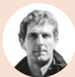
AHOZTAR ZELAIETA KAZETARIA