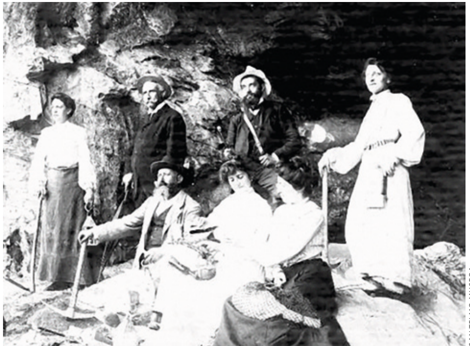
1903an Erreneriako Aizpitar-te kobazuloan egindako argazkian ikusten da indusketa lan horietan emakumeek ere parte hartu zutela.

1970eko hamarkadan egin ziren bi indusketek agerian uzten dute emakume