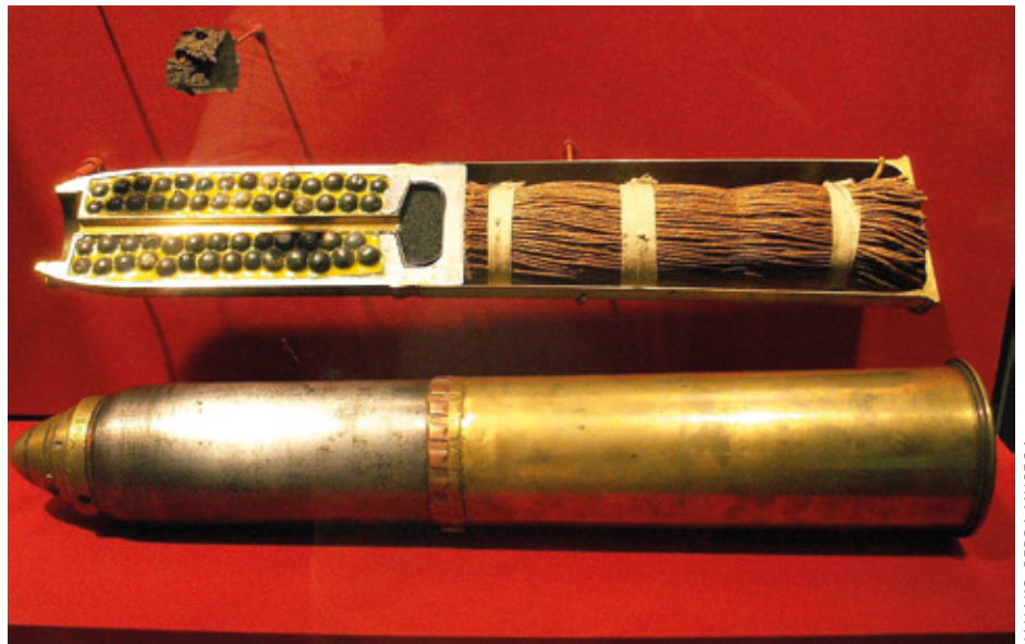
KANAKO GERRA MUSEOA

Baina, gerra ekonomian, arto eskasia geroz eta larriagoa zen eta urpekarri alemaniarrek arriskuan jartzen zuten etengabe AEBetatik zetorren arto hornidura. Orduan, Weizmannek bere metodo errazago eskura zitekeen produktu autoktono bati aplikatu zion: gaztainei.