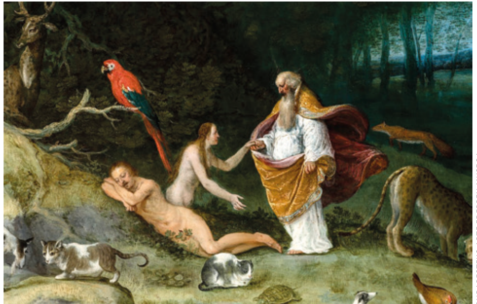
Evaren kreazioa , Adriaen Van Stalbem (c. 1620).

Esan bezala, Babiloniako egonaldi behartuan, judutarrek Mesopotamiako erlijioa ezagutzeko aukera izan zuten eta sumertarren hainbat mito bereganatu eta judaismoan txertatu zituzten: Joben liburuak, Pentateukoak eta Salomonen Kantuen Kantak hor dute jatorria, eta