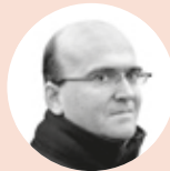
AINGERU EPALTZA IDAZLEA

E uskal Herriko azken inkesta soziolinguistikoaren Nafarroako emaitzak argitaratzean ikasi genuen: 2011tik hona, Foru Komunitatean indartu egin da euskararen erabilera sustatzearen kontrako jarrera, eta ahuldu, berriz, aldekoena. Euskal txio herrian, jendea ez da posible -ka ikusirik, xaloxalo menturatu nuen azalpen bat: “Nafarroako soziologia aldatzen ari da emigrazioaren eraginez. Kanpotik etorriek, nagusiki, bat egiten dute historikoki euskararen aldera arrotasunean bizi eta -80ko hamarkadaz geroztik- hezi izan den populazioaren zati handiarekin. Gure natalitate ahulak gainerakoa egiten du”.