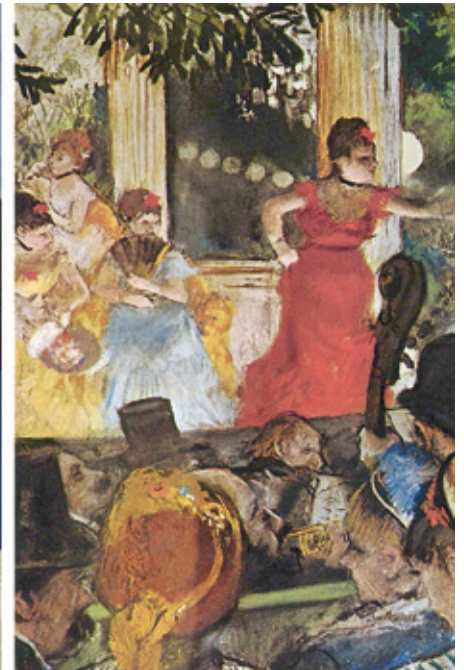
Ambassadeurs : Aristide Bruant, Henri Taoulouse-Lautrec (1882) eta Kafe kontzertua Les Ambassadeurs-en , Edgar Degas (1877). Bi artistek egile eskubideen jatorrian dagoen kafetegi ezaguna margotu zuten.

hasi ziren. Handik lau urtera, 1851n, Société des Auteurs, Compositeurs et Éditeurs de Musique (SACEM) sortu zen, musikarien egile eskubideen kudeaketa kolektiborako lehen elkarte. Mende luzez musikagileek mezenasgoari edo enkargu jakinei esker soilik lortzen zuten beren talentua bizibide egitea, baina 1847ko gau