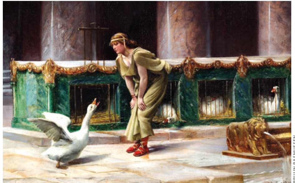
"Kapitolioko antzara sakratuak", Henri Paul Motte, 1889.

Veiiarrak mendean hartuta, handik sei urtera, beste mehatxu bati aurre egin behar izan zion Errepublikak; K.a. 390. urtean galiarrak, Breno buru zutela, Erromako ateetan zeuden, hiria hartzeko prest. Erraz sartu ziren eta topatzen zuten guztia birrindu zuten. Baina bizirik atera ziren erromatarrek Kapitolioan babestu ziren eta galiarren hainbat erasori aurre egitea lortu zuten. Brenok orduan gotorlekua gauez eta isilean hartzea erabaki zuen, harresian gora eginez. Txakurrek ez zuten zaunka egin, zentinelak lo hartu