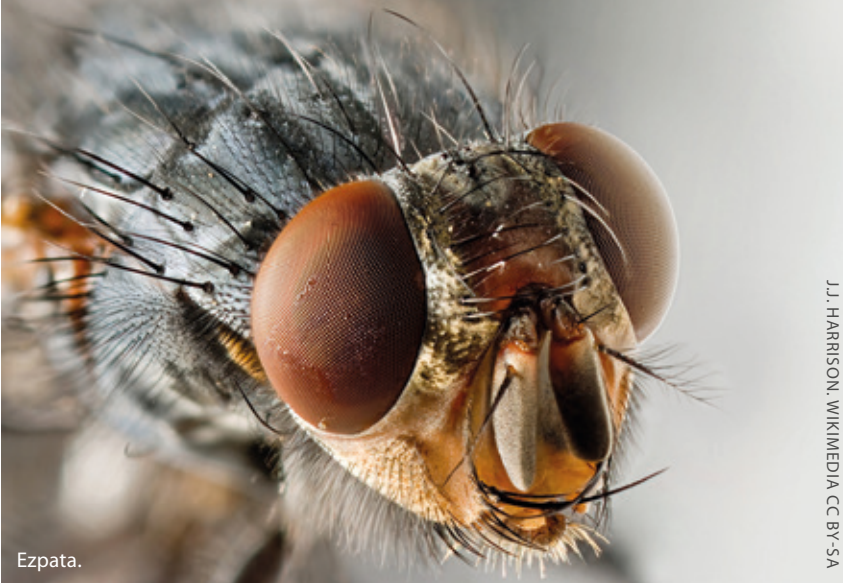
J.J. HARRISON, WIKIMEDIA CC BY-SA