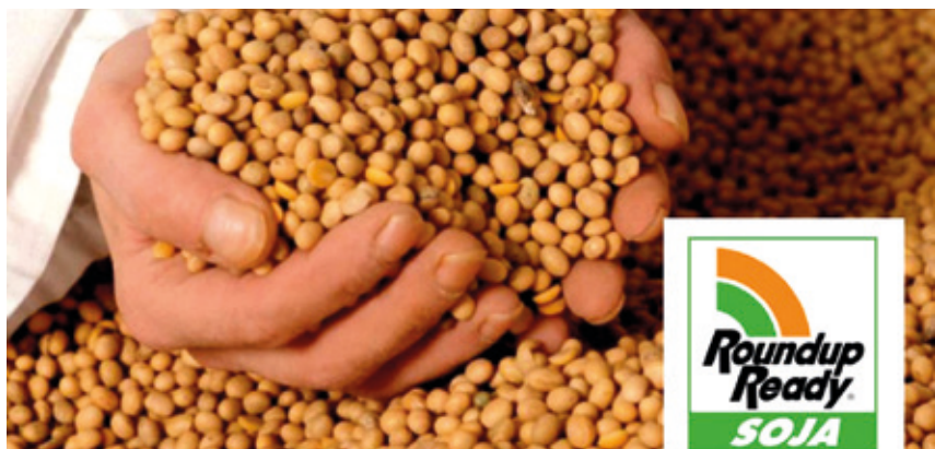
Monsantoren Roundup Ready soja-baba salmenten gorakada itzela izan da mundu osoan.

Era berean, artoari eta kotoiari Bt geneak gehitzeak intsektuen erresistentzia eta plagiziden erabilera areagotu ditu. 2022ko Pestiziden Atlasak dioenez, intsektiziden salmentek nabarmen egin dute gora AEBetako arto-ekoizpenean. 2018an Indiako nekazariak %37 diru gehiago gastatu zuten hektareako intsektizidak erosten 2002an genetikoki aldatutako kotoia sartu aurretik baino. 14 Duela gutxi arte, GE haziek gehienez hiru aldaketa genetikoki zituzten, baina 2018an Monsanto erosi zuen Bayerrek zortzi aldaketa genetikoki sartu ditu bere Smartstax Pro Corn delakoan. Eraldatutako hazi horiek glifosato eta dicamba herbizidak toleratzen dituzte eta, aldi berean, bost Bt toxina intsektizida desberdin sortzen dituzte; horrez gain, RNAn interferentzia teknologia berri bat erabiltzen dute artoaren -honi egiten dio kalte bereziki- funtsezko proteinen ekoizpena blokeatzeko.