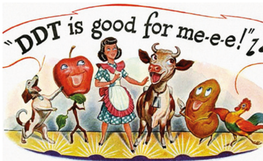
DDTari buruz Time aldizkarian 1947an argitaratutako iragarkia: “DDT ona da niretzat!”.

Negozio-plan horrek, suntsitzailer kimiko gehiago saltzeaz gain, produktu hilgarriagoak garatzea eta barreiatzea ere aurreikusten du. XXI. mendean, intsektuen populazioaren beherakada bizkortu egin da, bai pozoiz-dosi handiagoak aplikatzearen ondorioz, bai superpozoien belaunaldi berri baten sustapenaren ondorioz ere. Nekazariak aspalditik dakite intsektizida natural bat presta daitekeela tabakoa uretan beratzen jarriz eta detergente pixka bat gehituz itsaskor bihurtu dadin. Fruta eta landareak horrekin bustita, landare-zorreak eta beste intsektu xurgatzaile batzuk hiltzen ditu. 1992an, Bayerrek nikotinaren antzeko produktu berria sortu zuen, eta hiru urtean, intsektiziden munduko merkatua-