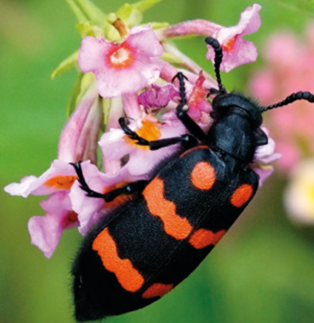
MYLABRIS PUSTULATA izeneko kakalardoa.