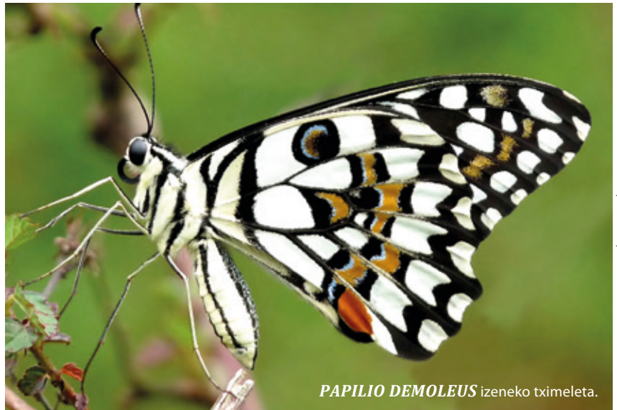
PAPILIO DEMOLEUS izeneko tximeleta.

“Mundu osoko intsektu-espezieen bi bosten desagertzeko arriskuan egon daitezke hamarkada gutxiren buruan; oro har, hiri- eta landa-inguruneetan suntsitzen ari dira, eta uretako inguruneetako kutsadurak ere saldoka hiltzen ditu. Intsektuak Lurreko ekosistemen funtzionamenduan sakonki integratuta daudenez, haien kopurua eta dibertsitatea nabarmen galtzeak ondorio kalkulaezinak izango lituzke; izan ere, litekeena da ekosistemen kolapso orokorra eragitea, gu eusten gaituena barne”. 13