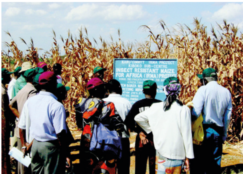
Genetikoki eraldatutako artoaren onurak azaltzen Keniako nekazariei.

ra egin zen nagusiki. Orduz geroztik, belar txarren kontrola produktu horiekin egin zen batik bat.