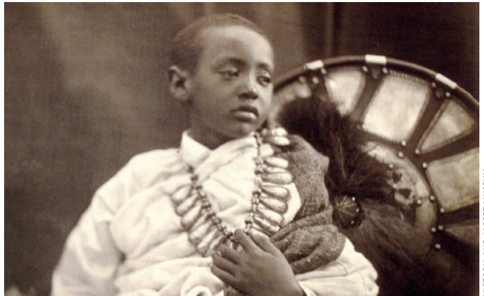
VICTORIA AND ALBERT MUSEUM

“Hain da tristea! Bakarrrik, herrialde arrotz batean, seniderik gabe. Ez zuen