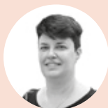
CASTILLO SUÁREZ IDAZLEA

G ogoratzeko ariketak fikziora jotzea dakar. Eta ezinbestekoa da gogortzea jarduera selektiboa izatea, biziraupen-estrategia bat den heinean; gauza batzuk gogoratzen ditugu, eta ez beste batzuk. Gertatzen dena da ez garela estrategia horietaz jabetzen eta oroitzapena gauza segurutzat hartzen dugula. Gainera, memoria da bizi dugunaren kontakizuna eraikitzekeo dugun mekanismoa. Egia esan, guztion bizitza zatikatua da. Gogortzean, kontakizun bat eraikitzen dugu eta zentzua ematen diogu. Eta eraikuntza hori fikziozkoa da. Gauzak nola bizi ditugun ere gure biziraupen strategiaren parte dira. Horiek horrela, batzuetan ematen du