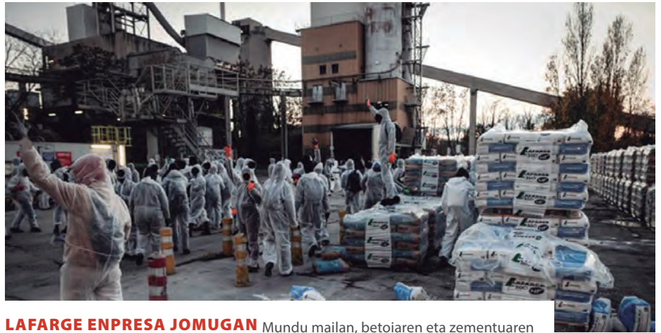
LAFARGE ENPRESA JOMUGAN Mundu mailan, betoiaren eta zementuaren sektoreko lehen indarra da enpresa frantses hori. Iazko abenduaren 10ean 200 ekintzailek burutu zuten sabotaje ekintza Lafargen Bouc-Bel-Air herriko lantegian, enpresaren jokoera klimatizidua geldiarazteko asmoz.

Klinkerraren kantitatea guttzeko ala deuseztatzeko bideak ere irekitzen dabilta, besteak beste iraunkorra-