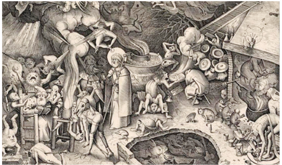
Brueghel Zaharrak grabatu honetan sorgina erratza gainean hegan irudikatu zuen lehenengoz 1565ean, eta irudia berehala errotuta geratu zen gizartean.