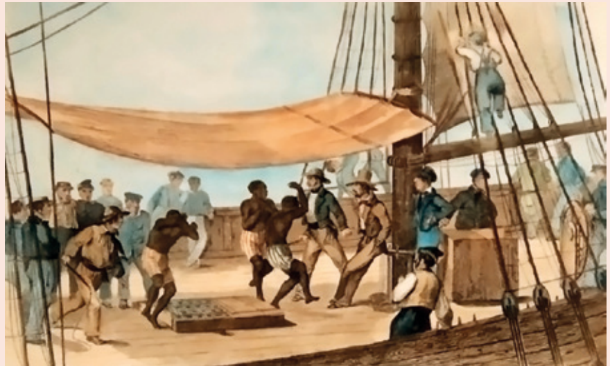
Itsasontzietan esklaboen hilkortasuna izugarri handia zen, ematen zitzaizkien tratuetatik, pilaketatik eta gaixotasunengatik.