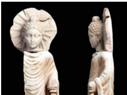
EGIPTOKO TURISMO MINISTERIOA

Mundua dardarka zegoen, gerra nuklearraren beldur, eta Telefono Gorriaren arduradunek umore apur bat jartzea erabaki zuten. Sobietarrek Moskuko arratseko zeruaren deskribapen poetiko batekin erantzun zuten. ●