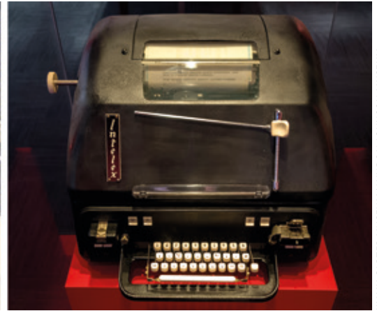
JIMMY CARTER MUSEUM/ LYNDON JOHNSON MUSEUM

rreko kodifikazio konplexuak ez ziren beharrezkoak.