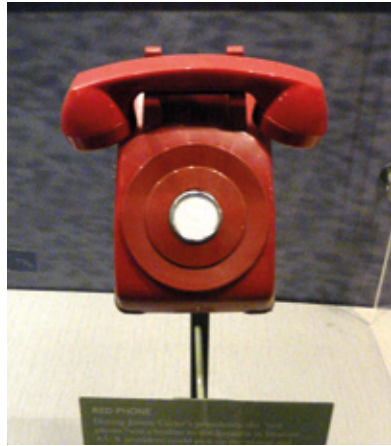
Jimmy Carter museoan dagoen ezkerreko telefono gorria ez zuten sekula erabili, objektu sinboliko hutsa da. Aldiz, eskuineko teletipoa 1967ko "telefono gorria" da.

Linea hura ez zen erabat zuzena: mezuak Washingtonetik abiatu eta Londres, Kopenhage, Stockholm eta Helsingkitik pasatzen ziren Moskura iritsi baino lehen. Baina ordurarteko bideekin alderatuta, "geldialdi" kopurua asko murriztu zen eta, beraz, mezua beste norbaitek atzemateko arriskua ere bai. Telefono Gorriaren bidezko mezuk ere zifratuta bidaltzen zituzten, baina au-