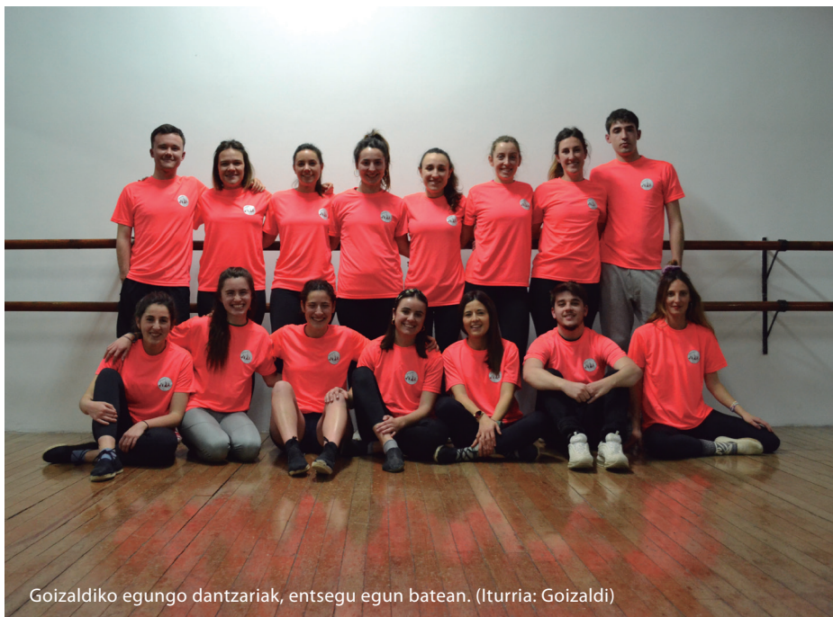
Goizaldiko egungo dantzariak, entsegu egun batean.

Dena den, baikor begiratzen diote geroari: “Zailtasunak gaindituko ditugu. Argi dago herritarrek oraindik ere dantza eskatzen dutela plazetan. Urtean zehar hainbat ekintza egiten dugu, eta jendeak propio bezala sentitzen ditu, ordezkatuta ikusten du bere burua”. Dantzariak ere gogotsu daude, ikasitakoa zabaldu eta gauza berriak probatzeko prest. Kultura kontzeptuak adierazpen estetiko gero eta estandarizatuagoak soilik biltzen dituela dirudien garai globalizatuotan, turistuholdeen azpian itotako Donostia honean, ez da gutxi jendeak dantza gosea edukitzea. ●