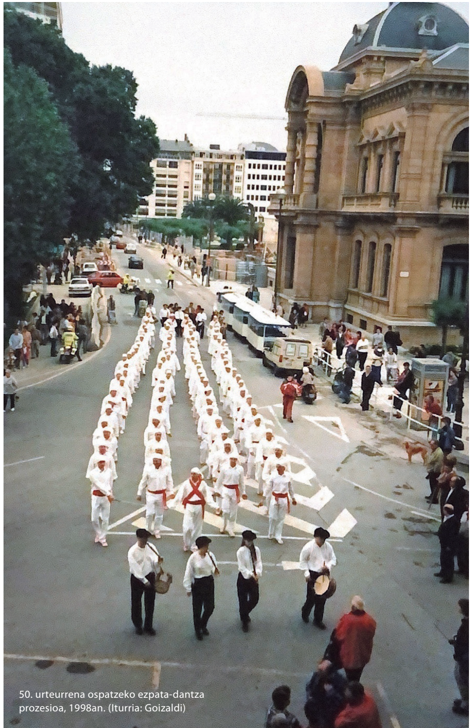
50. urteurrena ospatzeko ezpata-dantza prozesioa, 1998an.

Ibilbide oparoa izan da, eta hala oroitzen du Salamancak. "Guretzat ohorea izan da, eta kulturaren eta dantzaren osasunarentzat ere bai".