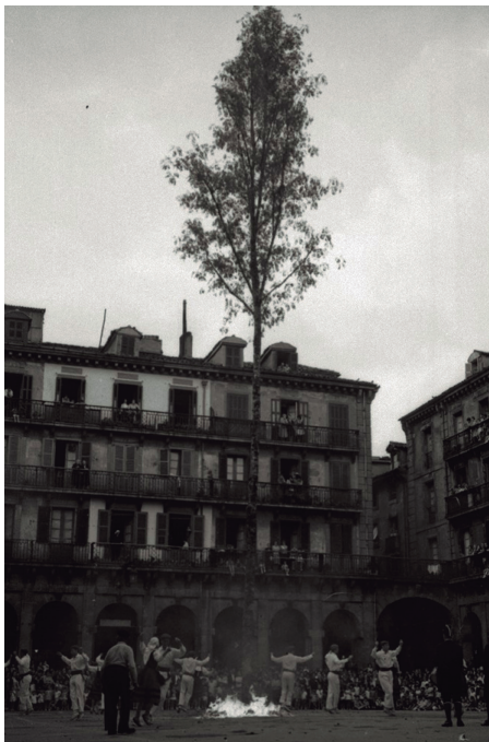
Donostiako Konstituzio Plazan, San Joan Bezperako soka-dantzan, 1950ean.