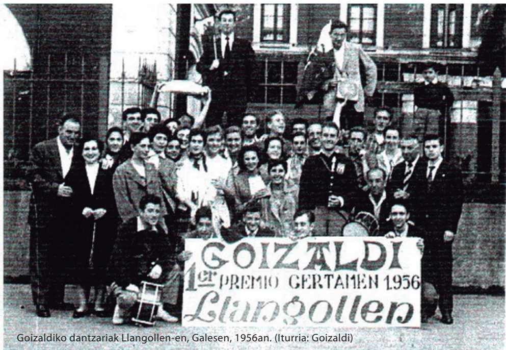
Goizaldiko dantzariak Llangollen-en, Galesen, 1956an.