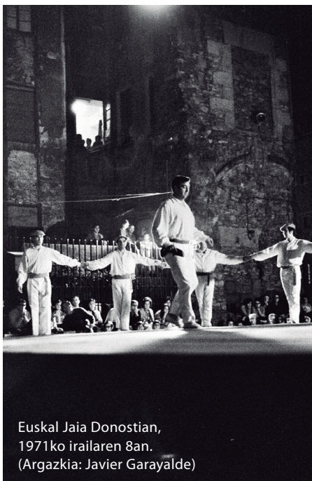
Euskal Jaia Donostian, 1971ko irailaren 8an.

Hirugarren erabaki garrantzitsua entsegu-aretoari lotuta egon da. “Beharra bazutela” diote, aitortzen dute, baina azken urteetan “hainbat arazo” izan dute antza. Horregatik garbitu eta txukundu egin dute aretoa, ispiluak eta altzariak berrituta, adibidez. Hala ere, kontserbatorioko zuzendaritzarekin izandako istiluen