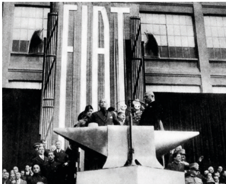
Benito Mussolini 1932an FIAT-en hitzaldia ematen, Giovanni Agnelli aldamenean duela.

Eta eragina izan zuen, gainera. Urte bereko uztailan, burgesia italiarrak Mussoliniren ordez agintean Badoglio jartzea erabaki zuen, Mussolini gabe ere faxismoari eusteko ahaleginean. Hainbat historialariren arabera, FIATeko greba Mussoliniren amaieraren hasiera izan zen. Eta ez zen kasualitatea izan mobilizazioak Mirafiorin piztea. Toynbeek berak zioenez, faxismoak boterea lortu zuenean ere “erresistentzia komunista-