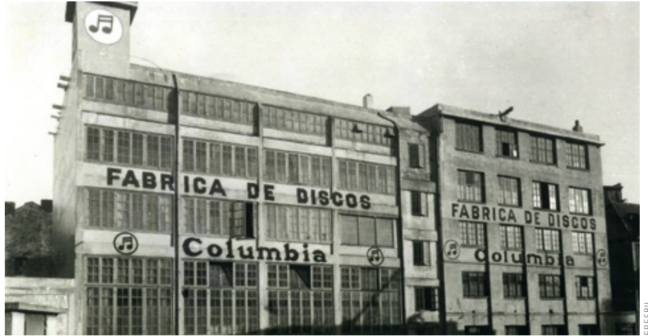
Donostiako Benta Berriko fabrika hau duela 100 urte hasi zen diskoak ekoizten.