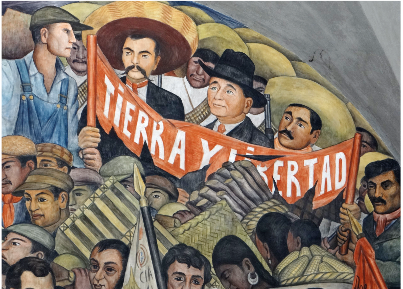
Emiliano Zapataren gidaritzapean XX. mende hasieran "Lurra eta Askatasuna" aldarrikatu zuten nekazari mexikar matxinatuak, Diego Riverak magotutako horma-irudi ospetsuan.

arren boterea komunitateko pertsona baten gain ezartzen zelako. Autonomiaren definizio berriari ekofeministak dira urrunen iritsi direnak, saiatuz biziraupen baldintzak eraikitzen pertsonen arteko menpekotasunak gaituz. Uste dut hori bera saiatzen dela egiten hainbat jende kooperatiba egituretan, produkzioa berrantolatze bidean betebeharrak modu ekitatiboan banatuz, pertsonen ahalmen eta nahien arabera gehiago, adibidez, sexuen arabera baino.