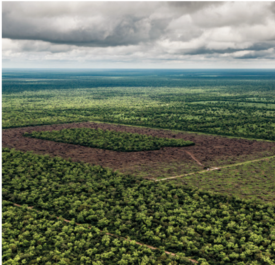
Brasilen bezala Perun, deforestazioa da indigenen lur komunalak ilegalki bereganatu eta pribatizatzeke metodo nagusietako bat multinazionalentzat.

Baina horretarako Lulak badaki, diru publikoa ondo kudeatzeaz aparte, Bra- silek duen baliabide komun nagusiena zaindu beharko duela, bere lurrak eta oihanak: “Brasilek ez du deforestaziorik behar nekazal muga estrategikoak za- baltzeko”, ohartarazi du. Bolsonaroren agintaldiaren amaieran oihanen soilteza %150 baino gehiago hazi zen, 10.000 ki- lometro koadro gainditzerraino, hainbat hedabidetan irakurri ahal izan dugunez. Auskalo horietatik zenbat diren jato- rriko herri indigenek mendeetan zehar ehizarako eta biziraupenerako zaindu- takoak.