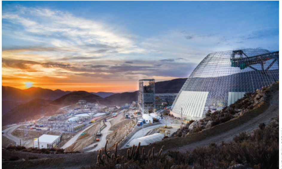
Anglo American multinazionalak Quelloveco (Moquegua) meatzean inbertsio handiak egin ditu, baina hango komunitateei apenas iritsi zaie etekinetatik ezer, eta Asana erreka kutsatu du esplotazioak.

Lurra, kolonialismoa, naturaren ustiaketa, kapitalismoa... Guillibertek tesia egin du gai horien inguruan, eta liburua ere argitaratu du: Terre et capital. Pour un communisme du vivant (“Lurra eta kapitala. Bizidunen komunismo baten alde”). 2022ko otsailean Tolosako Okzitaniako Terra Nova liburutegian izan zen lana aurkezten eta osorik ikus daite-