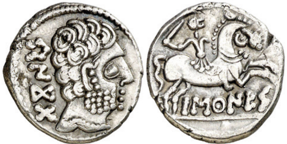
BARSKUNES Baskoien lurraldean egon zitekeen txanpon-etxe batean jaulkitako denarioak hainbat tokitan aurkitu dituzte. Bereziki harrigarria izan zen "Barkoxeko altxorren" aurkikuntza, 1879an Barkoxeko Ezpelea etxeko andreak bere ataritik lurrazaleratu baitzituen halako ehundaka. WIKIPEDIA

Azken hori da hobekien kontserbatu direnetako bat. Izen bereko mendiaren