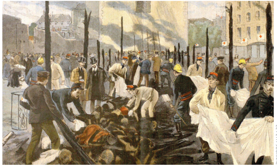
LE PETIT JOURNAL

Guztira 126 izan ziren hildakoak, horietatik 120 emakumezkoak. Egia da ekitaldiak emakume gehiago bildu ohi zituela –hala ere, ez proportzio horretan– eta haien soinekoek suari mesede eta ihes egiteko mugimenduei kalte egiten zieten. Baina gizonezko gehienek nahiago izan zuten “emakumeak eta haurrak lehendabizi” kontzeptua