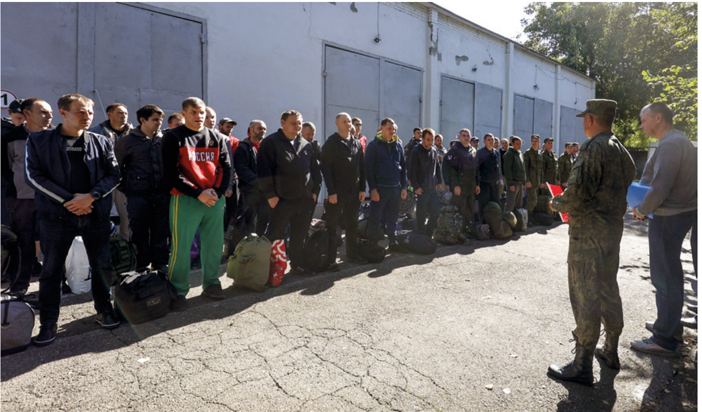
Irailako deialdian gudara mobilizatutako hainbat herritar.

Moskura, iristea lortu zuten. Zeukaten aukera bakarra zen.