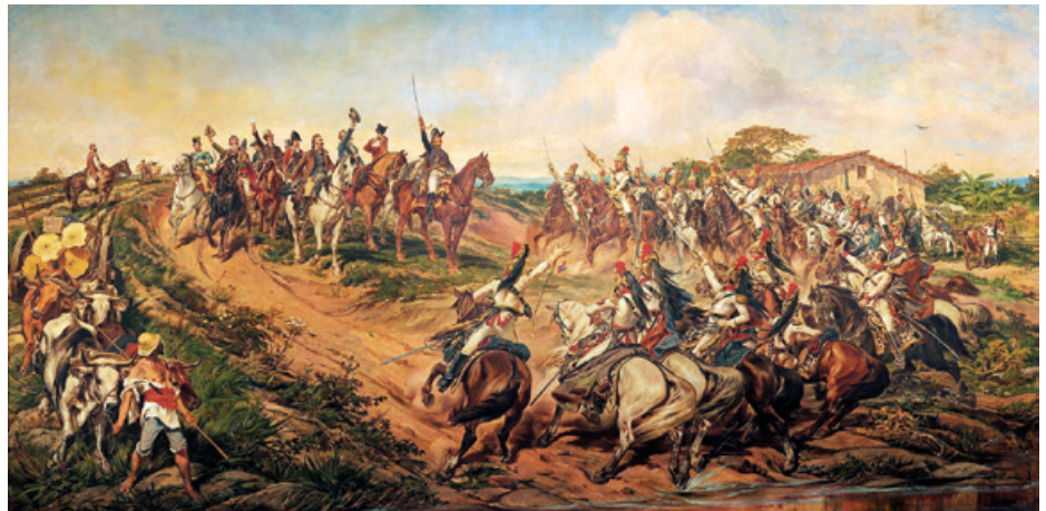
Independência ou morte! edo Ipirangako aldarria (Pedro Américo, 1888).

Ekonomikoki ere europarrekiko men- pekotasuna ezin izan zuten astindu. Bra- gançatarrak –eta, ondorioz, brasildarrak– zorretan zeuden Britainia Handiarekin, diplomaziaren bidez prozesuan laguntza eskaini zielako. Britainiarrek lehentasun- ezko baldintzak eta monopolioak lortu edota berretsiko zituzten, brasildarren merkataritza interesen kaltetan.