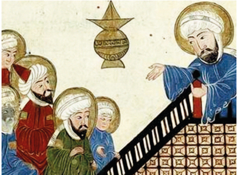
Mahoma Mekan, Korana predikatzen. Al-Biruni dokumentuaren XVII. mendeko kopia otomandarra.

520. urte inguruan hasita, lehorte bortitz eta luzeak jo zuen Himyar. Estatuaren