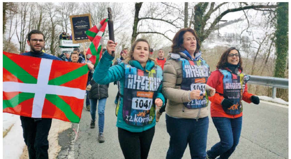
Gure Eskuk, ANC-k eta Omnium Culturelek Korrikaren lekukoa elkarrekin hartu zuten, Ibañetan.

“Erabakitze eskubidearen aldeko erreferendum adostua aldarrikatzen