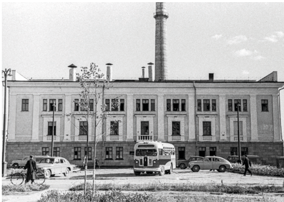
1954ko ekainean Obninskeko errektore nuklearra sarera konektatu zuten eta, horrenbestez, munduko lehen zentral nuklear zibila martxan jarri zuten.

hori irabazteko osagai militarra funtsezkoa izan zen, edo hobe esanda, osagai militarra baztertu izana. AEBetako programaren helburua gerraontziak eta itsaspekoak energiaz hornitzea zen, eta sobietarrek, aldiz, behar zibilak asetzeko erabiliko zuten. Zalantzarik ez dago erabakia kontzienteki hartu zutela: Ob-