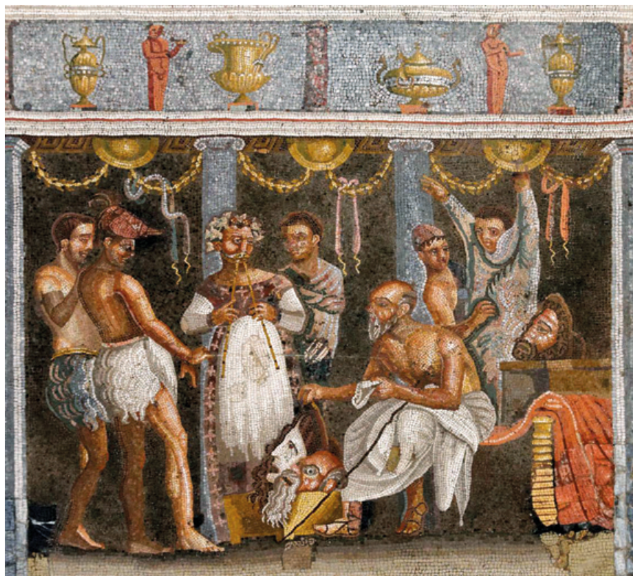
NAPOLIKO MUSEO ARKEOLOGIKOA

Aztertutako testuen artean IV. mendeko Philogelos bilduma dago, orain arte aurkitu den txiste bildumarik zaharrena. Grezieraz idatzita egon arren, Erromako 265 txiste jasotzen ditu. Hauxe da horie-