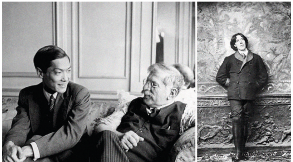
Duela 125 urte LGBT eskubideen aldeko munduko lehen erakundea sortu zuten Berlinen, besteak beste, Magnus Hirschfeld sexologoa (ezkerrean, Li Shiu Tong bikotekidearekin). Handik egun gutxira, Ingalaterran, Oscar Wilde (eskuinean) aske utzi zuten.