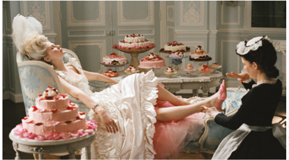
Maria Antonieta pastelaz inguratuta. Sofia Coppolaren Marie Antoinette (2006) filman.

Orain badakigu zein izan zen senar-emazteen amaiera, baina Luis XVI.a gillotinatik Maria Antonieta baino lehenago pasa arren, austriarraren lepoa eskatzen lehenago hasi ziren. “Madame Defizit”, “austriar otsemea” eta halako ezizenak jarri zizkieten, eta bere jatorria baliatuz hitz joko berezia egiten zuten; “ autrichienne ” (austrarra) esan beharrean, “ autre chienne ” (beste txakur emea) esaten zioten. Gortean bereha-