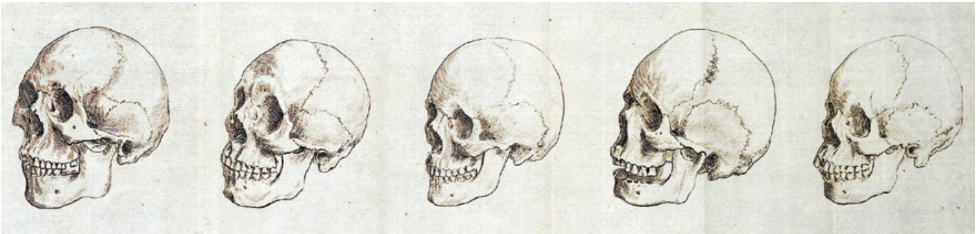
1775ean, Johann F. Blumenbach (1752-1840) antropologoak bost giza arraza bereizi zituen garezurraren arabera, eta “kaukasoar” hitza erabili zuen horietako bat deskribatzeko.

Hala, “kaukasoar” hitza “zuria” esateko modu politikoki zuzena bihurtu da, jatorrian arrazista eta, gainera, zientifikoki okerra den arren. ●