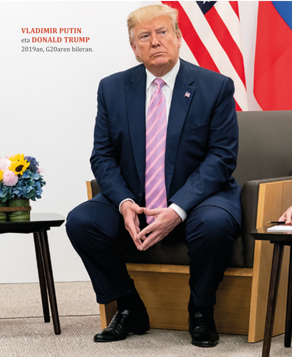
VLADIMIR PUTIN eta DONALD TRUMP 2019an, G20aren bileran.

buruz aritzeko eta espero dut irakurleek ez zutela ikusiko hitz horretan "epaitzen duen definizio" horietako bat. Harluxet hiztegi entziklopedikoaren arabera, "naturaren legeez at eratuturiko izaki biziduna" da munstroa. Hemen aipatu ditugun munstroek, hain zuzen, ezagutzen genuen natura politikoaren legetatik at jokatu dute eta haien ezohikotasunaz aritzeko hitz aproposa iruditu zait.