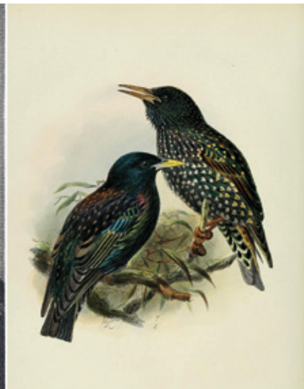
MARTIN DROESHOUT ZAHARRA / HENRY E. DRESSER