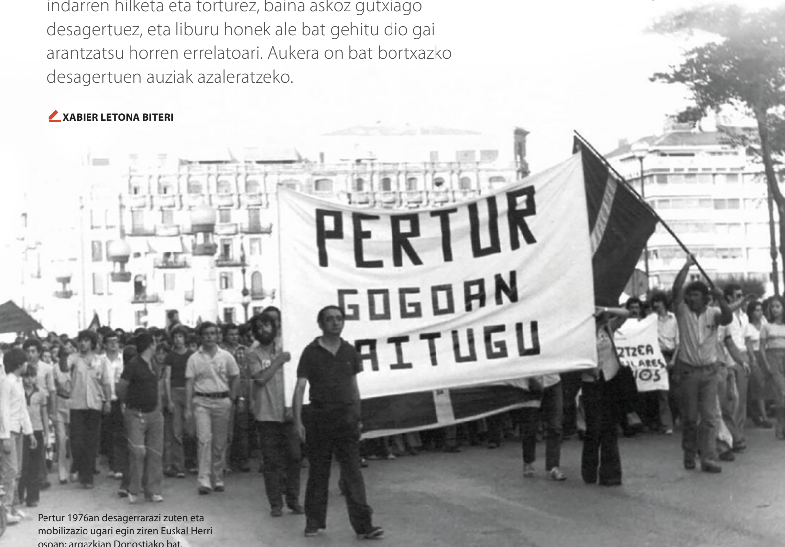
Pertur 1976an desagerrarazi zuten eta mobilizazio ugari egin ziren Euskal Herri osoan; argazkia Donostiako bat.

Kasu batzuk ezagunak dira, beste batzuk ez, baina gehienetan dira berrikuntzak, gutxienez ikerketen oso gainean ez dagoenarentzat; eta mundu bat eskaintzen dio halakoez ezer gutxi dakienari.