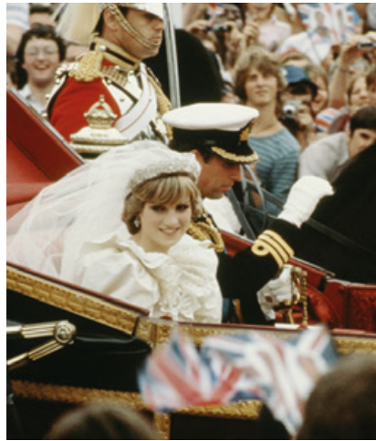
Liverpooletako Toxteth auzoko liskarrak eta Karlos Galesko printzearen eta Diana Espencerren ezkontza, biak 1981eko uztailean.

Horrez gain, Erresuma Batua industria krisi larrian murgilduta zegoen. Langabezia eta pobrezia datuak bereziki larriak ziren Merseyside eskualdean, Liverpool hirian eta, bereziki, Toxteth auzoan. Ez da harritzekoa uztailearen hasieratik istiluek auzoko kaleak hartu