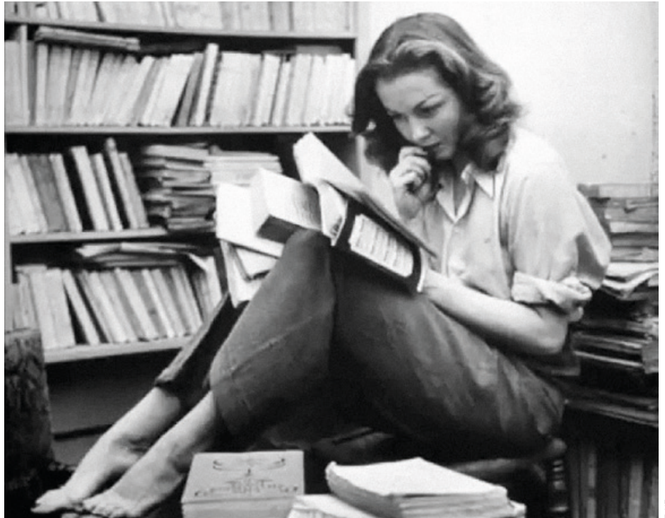
Sylvia Plath (1932-1963) hiri-gasa arnastuta hil zuen bere burua, Londresen gas naturala hedatzen ari zen garaian.

Gladwellen beste teoria batzuk bezala, hau ere zalantzan jartzen du hainbatek, kategorikoegia delakoan, beste faktore batzuk ez dituelako kontuan hartzen, esaterako, 1930eko hamarkadako igoeran 1929an piztutako krisialdi ekonomikoak izan zuen eragina. Baina Gladwellek bere teoriarekin esan nahi duena da, suizidatzeko joera dutenei aukerak “zailduz” gero, denbora eta egoera iraultzeko aukera ematen zaiela. Sekula ez dugu jakingo zer gertatuko zen Sylvia Plathek Londresen alokatutako etxean gas naturala instalatuta egon izan balitz. Lehenago ere beste bitan saiatu zen