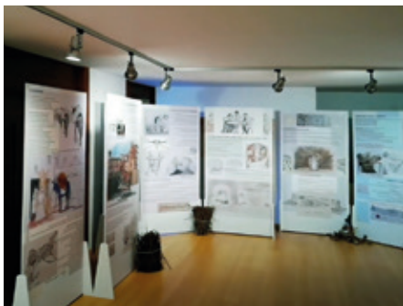
ARABAR ERRIOXAKO KOMUNITATEA

tik, gero horiei erantzuteko balio duten arren. Eibarren asmatutako grapagailuez gain, jatorri militarreko beste asmatutako izan dira gure bizimodua aldatu dutenak: zinta itsasgarria, janari ontziratua, mikrouhin labea, kontaktuzko kola, konpresa menstrualak, radar meteorologikoak, internet, kautxu sintetikoak pneumatikoak... ●