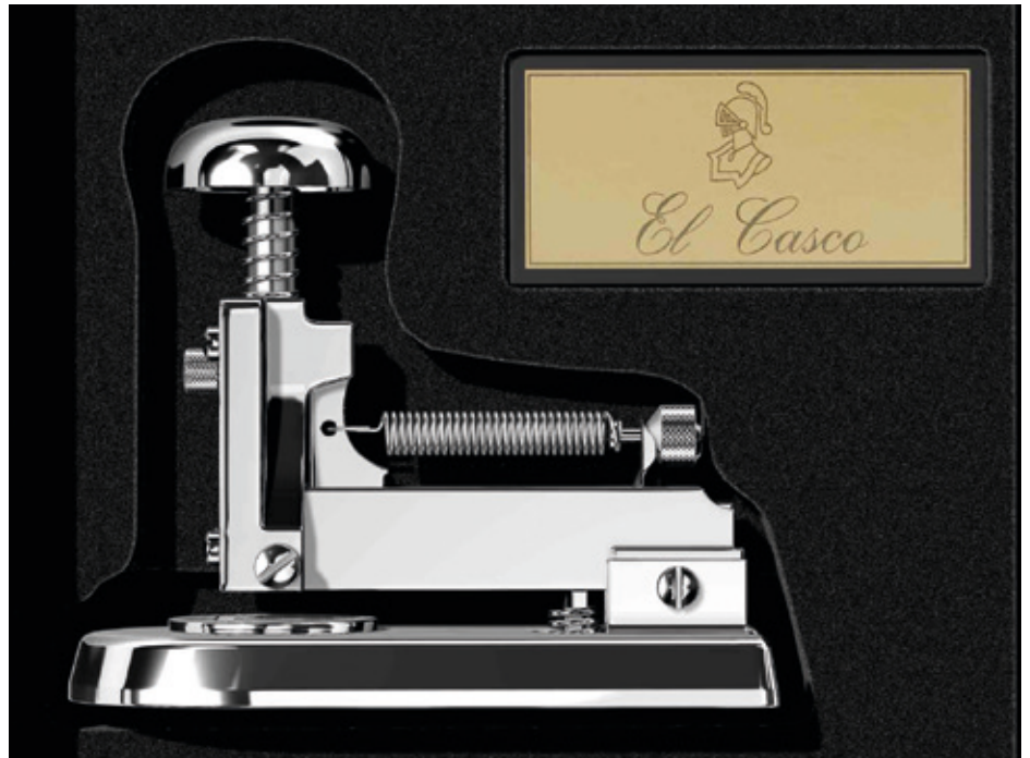
Eibarko bi armaginek M-5 grapagailua sortu zuten 1932an. 90 urte geroago, modeloa oraindik ekoiztu eta mundu guztian saltzen da.

Paper-zulagailuak, txorroskiloak edo gutun-pisuak ere ekoizti zituzten, baina grapagailua izango zen enpresaren produktu izarra, bereziki 1932an M-5 modelo ezaguna egin zutenetik. Gaur egun, Elgetako fabrikari El Casco oraindik M-5a ekoizten du eta mundu osoan saltzen da. Gainera, 90 urteko modeloa