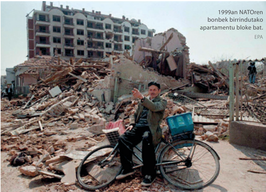
1999an NATOren bonbek birrindutako apartamentu bloke bat.

laviari eraso egiteko plan bat abian jartzeko aukera politikorako egitura sortu zuten. AEBek UÇK talde terroristen zerrendan zuten, baina gatazkaren gorakadarekin Washingtonek ulertu zuen eskura zuela Jugoslaviari eraso egiteko aitzakia; horrela goizetik gauera UÇK Mendebaldeko aliatu bilakatu zen.