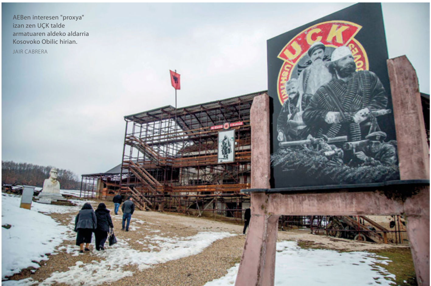
AEBen interesen "proxya" izan zen UÇK talde armatuaren aldeko aldarria Kosovoko Obilic hirian.

1998an, UÇKren (Kosovo Askatzeko Armadaren) eta Jugoslaviako segurtasun-indarren arteko liskarrak gogortu egin ziren. Ondorioz, bi aldeek giza esku-bideen urraketak areagotu eta Jugos-