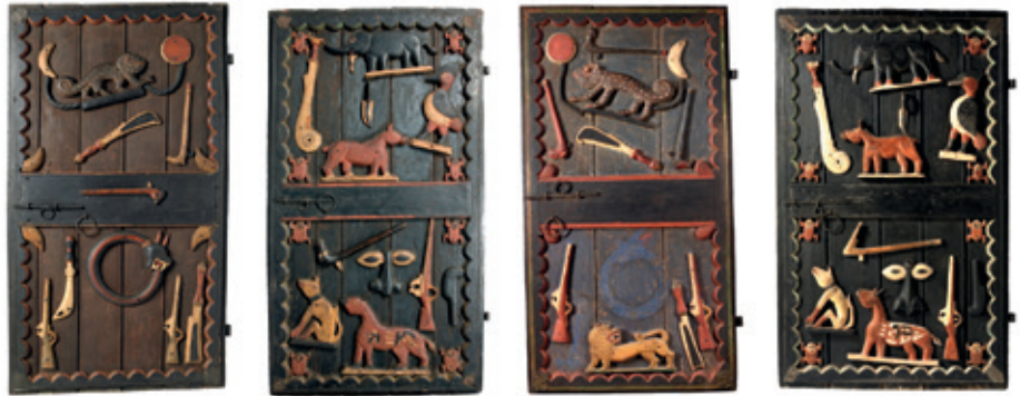
Dahomeyko jauregiko atek, frantziar ejertzitoak XIX. mende amaieran lapurtuak eta berriki Beningo gobernuari itzuli dizkietenak.