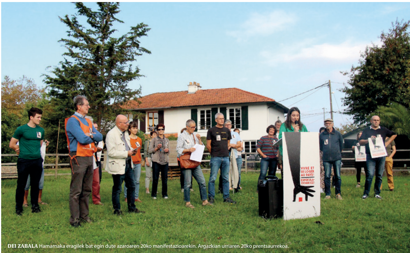
DEI ZABALA Hamarnaka eragilek bat egin dute azaroaren 20ko manifestazioarekin. Argazkian urriaren 20ko prentsaurrekoa.