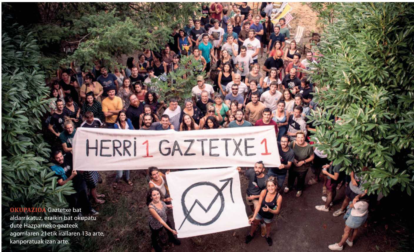
OKUPAZIOA Gaztetxe bat aldarrikatuz, eraikin bat okupatu dute Hazparneko gazteek agorrilaren 21etik irailaren 13a arte, kanporatuak izan arte.